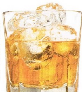
ON THE ROCKS