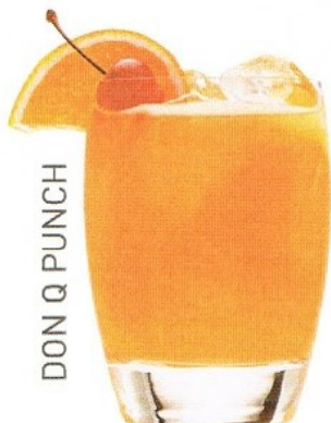
DON Q PUNCH

88 Points Very Good, Strong Recommendation